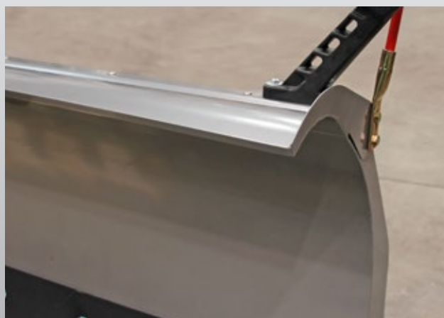
Stahl-Schneeabweiser für Gerade-Pflug (optional)